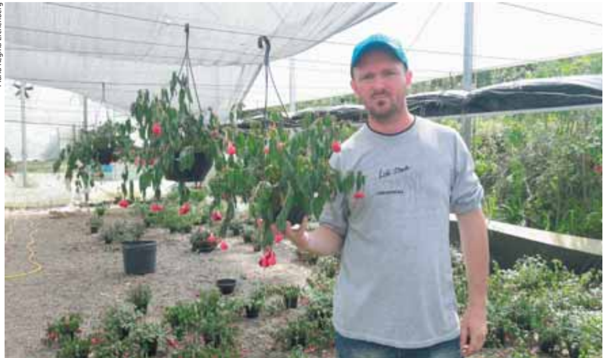
■■ Berlt mostra flores que murcharam por falta de irrigação adequada. Estufa também foi danificada

Conforme a RGE, até o fim da tarde de ontem, 900 clientes estavam sem energia em Santa Cruz do Sul. A maioria dos casos aconteceu no interior do município. De acordo com a Brigada Militar do distrito de Monte Alverne, a localidade estava sem luz e sem telefone até as 20 horas de terça-fei-