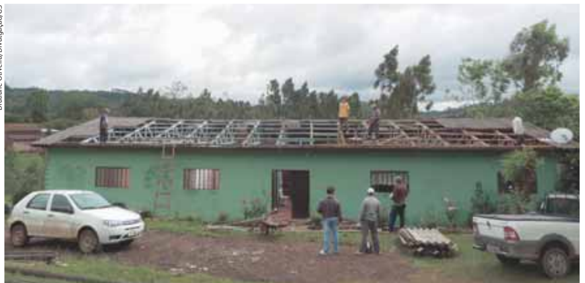
■■ Equipes da Prefeitura de Herveiras percorrem todo o interior para avaliar o tamanho dos prejuízos

Outubro deve ter registro de chuva acima da média e ventos com velocidade acentuada, nos dias 24 e 25. No demais dias, a estabilidade deve predominar. Observando os cenários climáticos dos meses anteriores, no entanto, foi afastada definitivamente a formação do fenômeno El Niño para o segundo semestre deste ano. Apesar disso, as concessionárias intensificam o monitoramento do clima neste fim de ano, quando é registrado o período de temporais na Região Sul, assim como ocorreu no fim de semana. ■