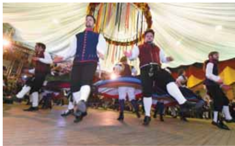
■ Grupos de dança do 25 de Julho e Oktobertanz se apresentaram

ças, acrobacias e técnicas de interpretação típicas do circo. Em busca do amor, os personagens viajaram no voo das acrobacias e nos movimentos das danças, encantando a plateia com imagens fortes e alegres. Regada a muito chope, aos embalos das bandinhas típicas, shows locais e nacionais, a Oktoberfest segue até o dia 15.