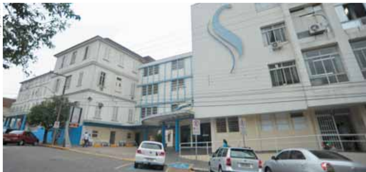
■ Hospital Santa Cruz foi surpreendido pela decisão do Estado de postergar o repasse de R$ 400 mil

A Federação das Santas Casas e Hospitais Benéficos, Religiosos e Filantrópicos do Rio Grande do Sul, entidade que representa os 271 hospitais sem fins lucrativos do Estado, di-