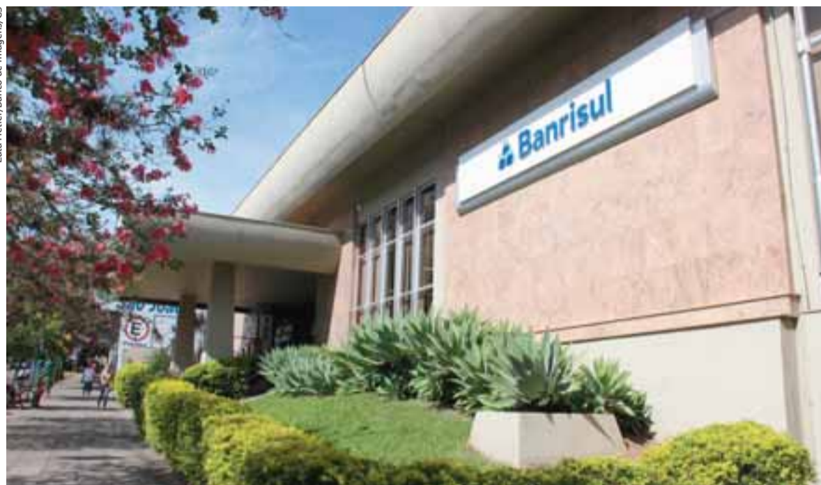
■■ Governo decidiu anunciar a oferta pública agora porque ações do Banrisul se valorizaram este ano