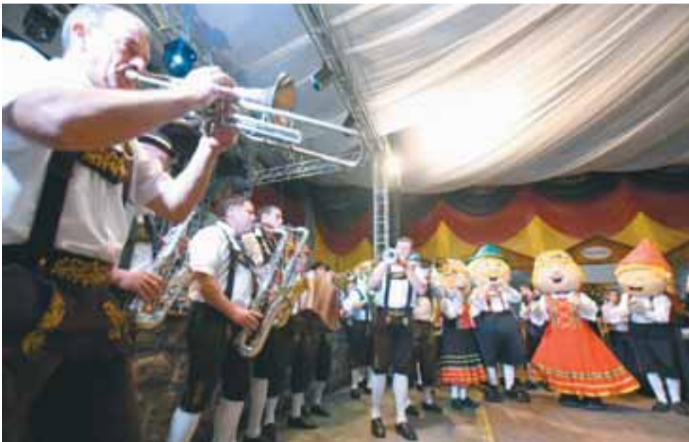
■ Animação da bandinha deu o tom do que os visitantes terão nos próximos dias