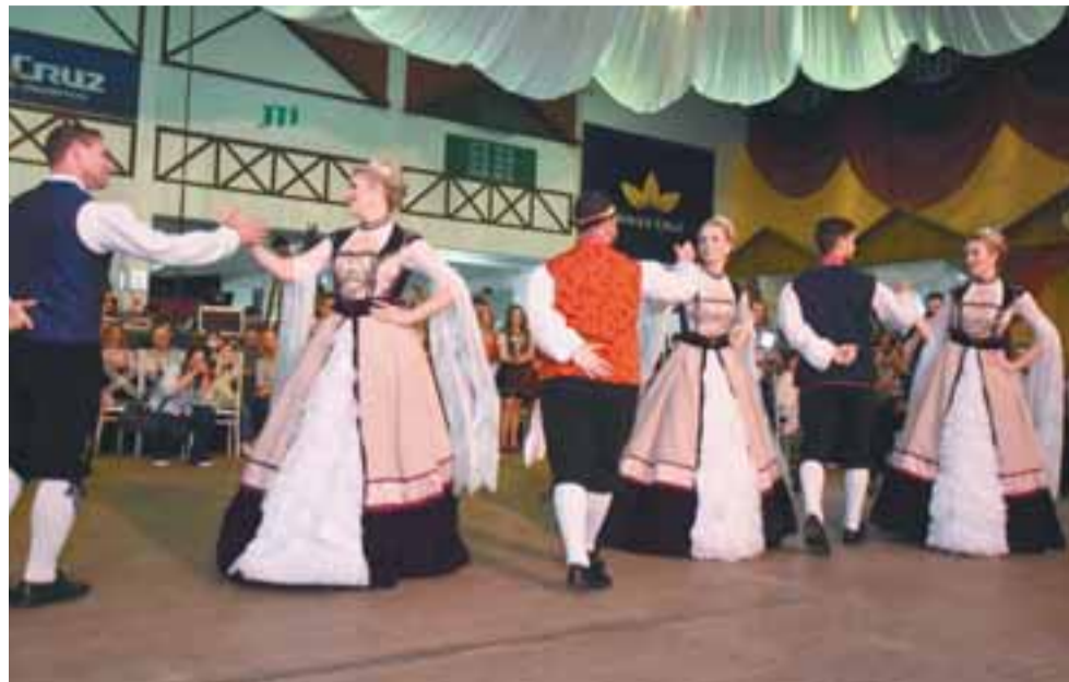
■ Rainha e princesas surpreenderam ao fazer coreografia com seus pares no salão