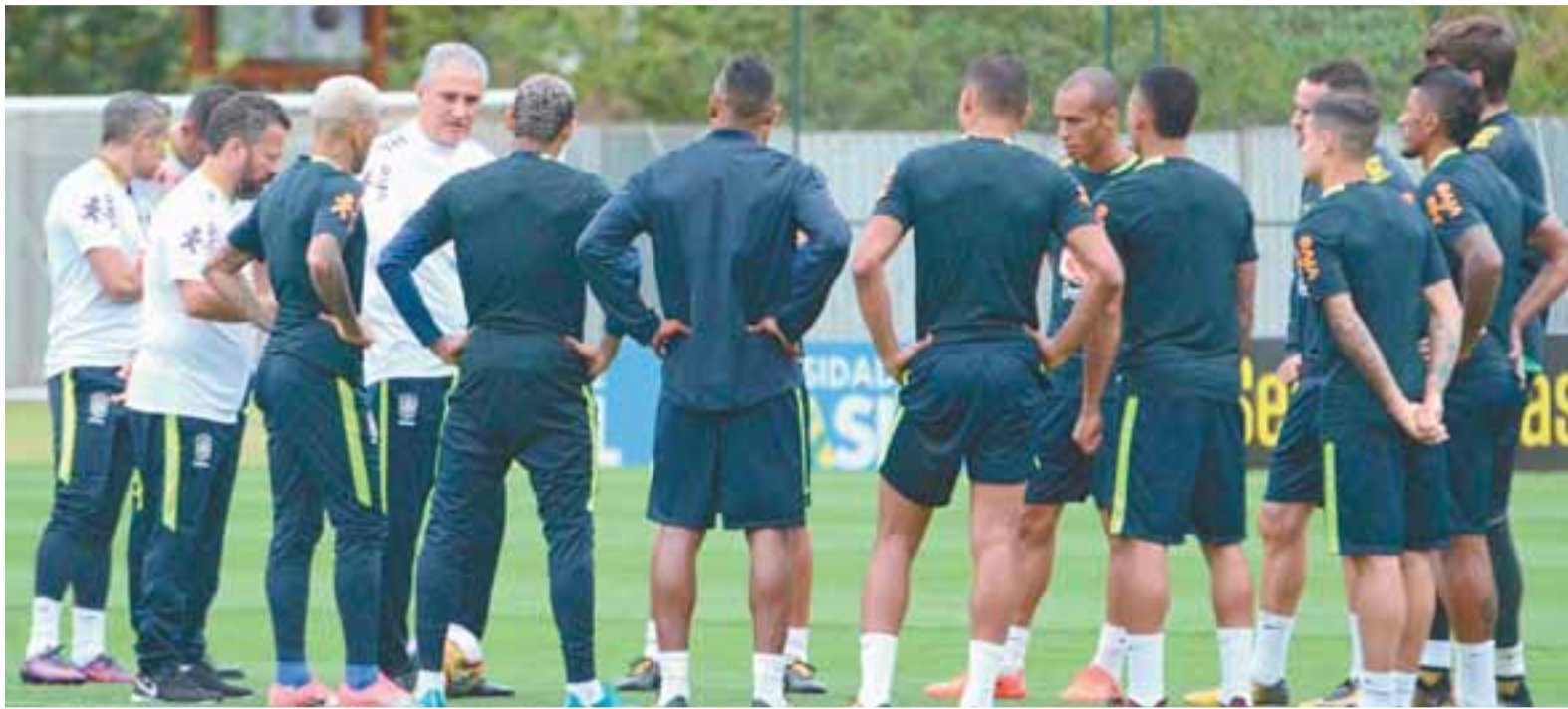
Seleção de Tite tem a missão de quebrar um jejum de 32 anos sem vitória na capital boliviana, a 3.660 metros de altitude. Página 22