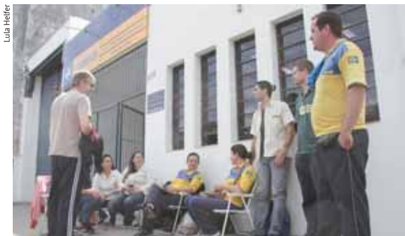
■ Grevistas permanecem na frente da unidade da Ernesto Alves

Em Santa Cruz do Sul, haverá uma nova assembleia amanhã, às 14 horas, no Sindicato dos Comerciantes, para que a ata da audiência seja avaliada e se decida os rumos do movimento. Foi sugerida a compensação de metade dos dias paralisados, reajuste salarial com base no Índice Nacional de Preços ao Consumidor (INPC) e a manutenção das cláusulas do acordo coletivo 2016/17. A única pauta que continuará fora é a referente aos planos de saúde, que tramita em ação separada.