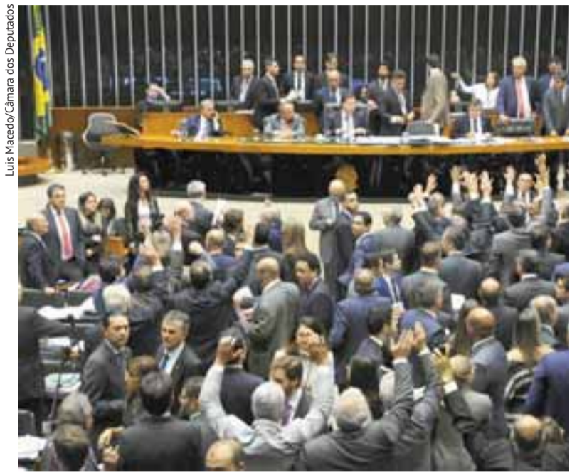
Em meio à confusão, deputados aprovaram texto que cria fundo